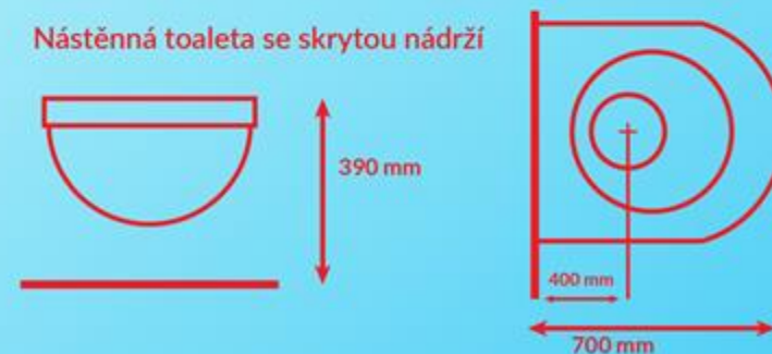
Nástěnná toaleta: JIKA H8 Model 20642